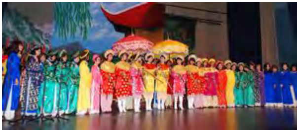
Đoàn rước kiệu Hai Bà trong lễ hội Trưng Vương 2009.